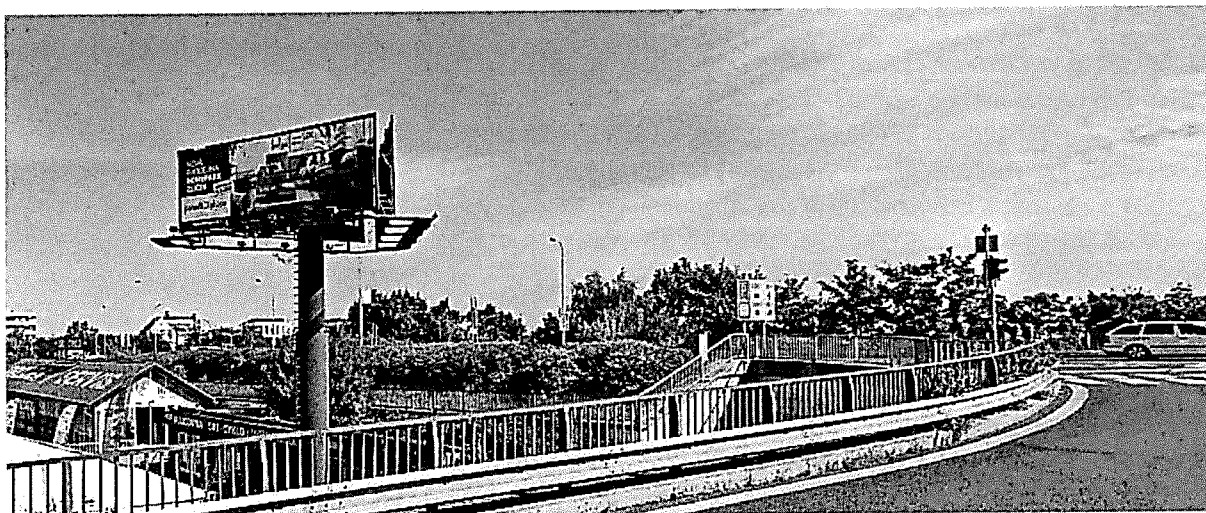
Reklamní zařízení č. 4: Parcelní číslo 321/3 v katastrálním území Praha – Třebonice (GPS souřadnice 50.052038, 14.291313)